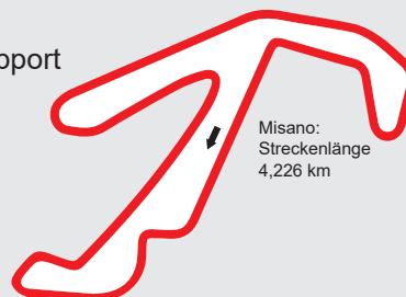
Misano: Streckenlänge 4,226 km